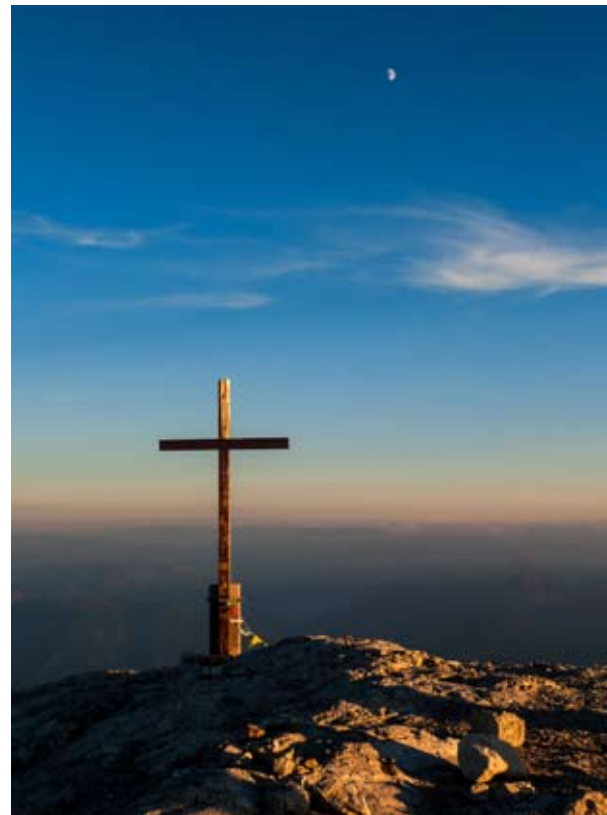
Abend auf dem Gipfel des Hochkönig